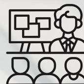
Курсы для преподавателей