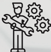
Курсы для системных администраторов