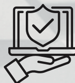
Курсы для специалистов по ИБ